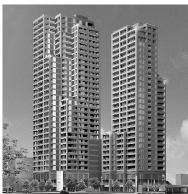
▲右がグレースタワーII

冬号で紹介した岡山市中心部柳川ロータリーに建築中の「グレースタワーII」 今までのマンションに無かった、色々きめ細やかな配慮がされています。只今販売中。残りもあとわずかとなっております。 モデルルームは岡山市大供(岡山市役所近く)に有ります。 お問い合わせは、086・2333・0373まで