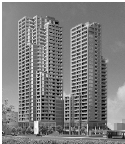
▲右がグレースタワー

皆様ご存知ですか？ 今岡山駅前（柳川口一タリ）に岡山で一番のノックビル「両備グレースタワー」が建っています。その隣で現在工事中なのが、今回ご紹介する「グレースタワー」です。 1階〜29階まで有ります。1階〜3階までテナントが入り4階から分譲マンションになっています。只今販売中、残もあとわずかとなっています興味のある方は、お問合せ下さい。