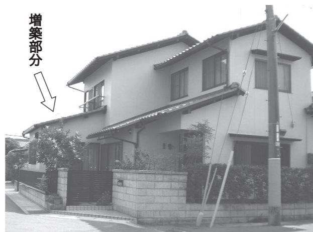
リフォームが完了したH邸▲